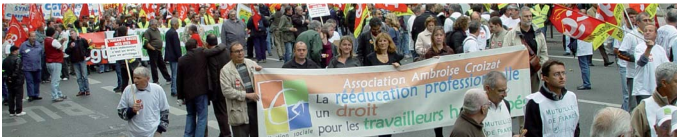
Association Ambroise Croizat, 94 rue J.P. Timbaud, 75011 PARIS / Tél. 01.43.14.73.00 / Fax. 01.43.14.73.01

et j'adresse un chèque de ..... € libellé à l'ordre de l'Association Ambroise Croizat.